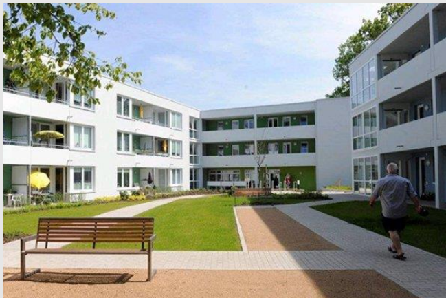
Casa alla Vela intergenerational housing (Itaalia)