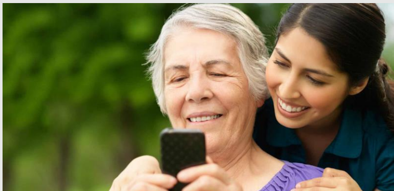
Big Launcher (Tsehhi)