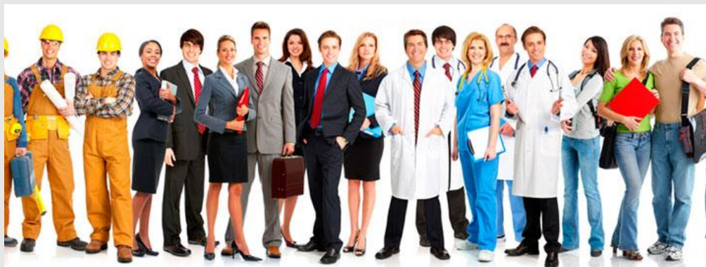
Everyday rehabilitation (Taani)